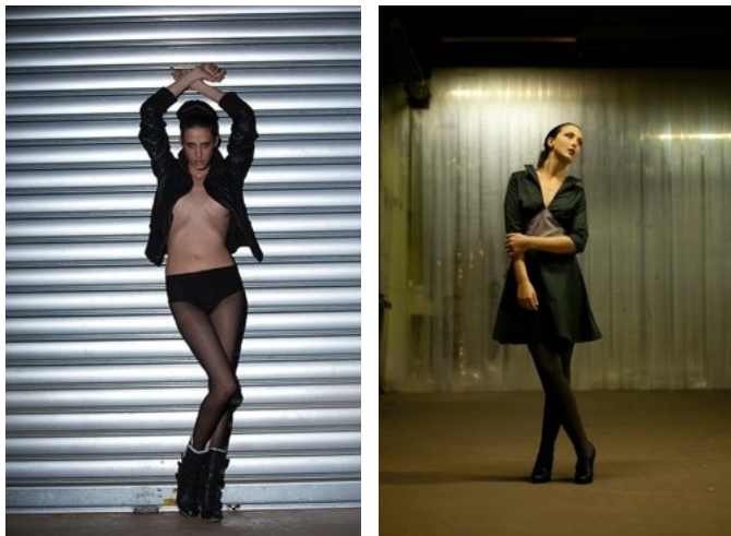
Volet métallique et baches plastiques

Le couloir de l'Ideal Studio propose de nombreuses textures et ambiances. Que ce soit avec des murs en briques, des peintures écaillées façon Cuba, des bâches plastiques, des murs en plâtre ancien ou encore des portails métalliques tout est là pour créer. Dans le couloir vous pouvez travailler en lumière artificielle (néon), naturelle (à côté du portail).