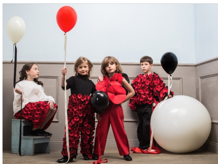
Le mur hausmanien

Tous les lieux sont accessibles avec le même prix de location. Plus de photos sur notre site